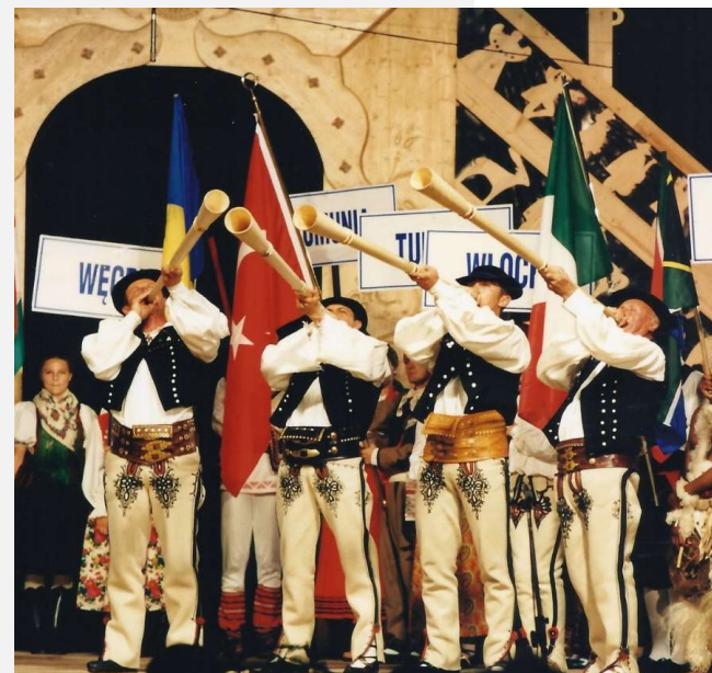
Międzynarodowy Festiwal Folkloru Ziem Górskich w Zakopanem, jego dzieje sięgają czasów II Rzeczypospolitej, a rodowód można łączyć z koncepcją "Związku Ziem" wyrosłą na gruncie podhalańskiego regionalizmu, skonkretyzowaną w latach 20-tych XX w. przez Władysława Orkana. Proponowana przez niego koncepcja zakładała zjednoczenie wszystkich grup zamieszkujących polskie Karpaty, od Huculszczyzny aż po Beskid Śląski

Światowy Festiwal Polonijnych Zespołów Folklorystycznych w Rzeszowie